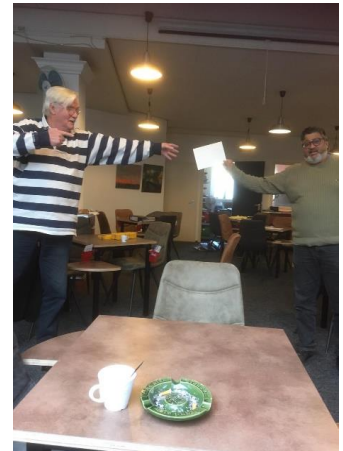
Op anderhalve meter afstand