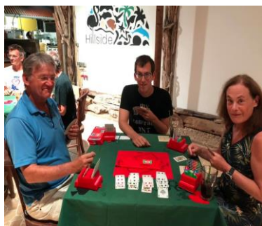
Tussenstop in Oranjestad

De conclusie is in ieder geval dat dat bridgen in het buitenland absoluut de moeite waard is! Wanneer je je met een bridger in het buitenland bevindt: ga vooral eens op zoek naar de lokale bridgeclub om te vragen of je een avondje mee mag doen, via Facebook of Google kom je een heel eind. En natuurlijk: zorg dat je je biddingboxen altijd in je handbagage vervoert 😊