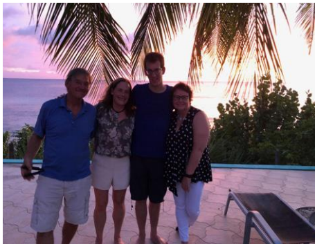
Uitrusten van het spelen