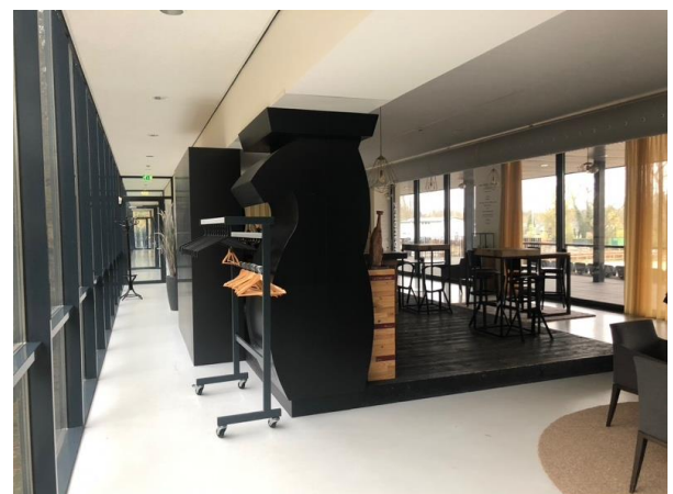
Bar vanaf andere zijde met toegang naar het terras