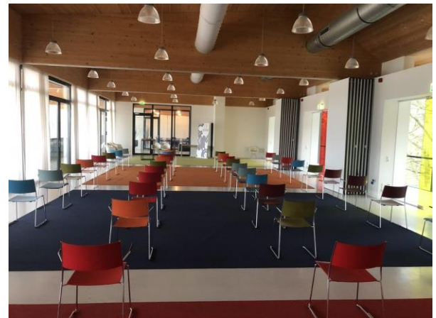
De speelzaal (2 e etage), 4 skyboxen die met tussenwanden zijn af te scheiden; links vier deuren naar het overdekte balkon