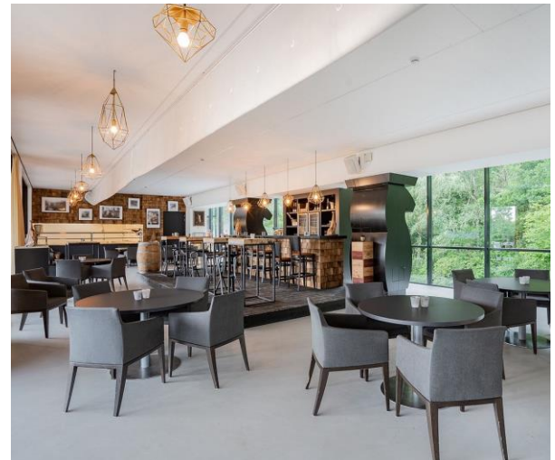
De bar (en op de achtergrond de keuken) op de 1 e etage