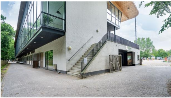
Het pand van het CHIO aan de Kralingseweg