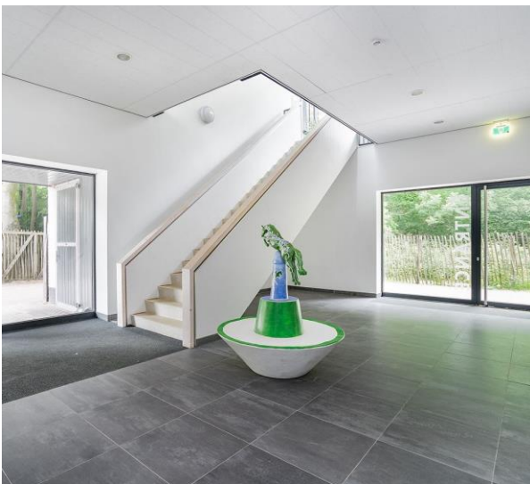
Entree met trap en lift