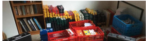
De spelmaterialen staan al veilig op zolder bij Otto....

verenigingen geen huur meer aan HKF. Het uitruimen en pakken is al begonnen.... Een aantal spullen die we niet meenemen worden verkocht of kunnen gratis worden afgehaald door leden. Heb je interesse? Houd de website van Denksportcentrum de Lombard in de gaten.